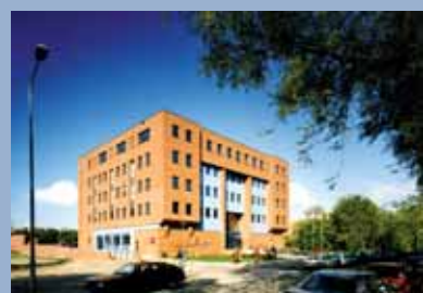
CBR-kantoor, Amsterdam [1995]