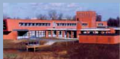
Kliniek voor Verslavingszorg De Griff, Arnhem [1999]