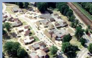
Psychiatisch Centrum, Wolfheze [1985]