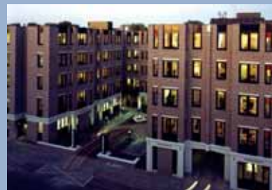
Huize Kohlmann Beth Zikna, Arnhem [1982]