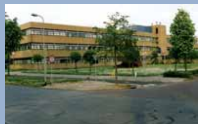
Belastingkantoor, Zutphen [1996]